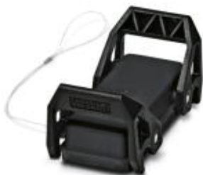
Couvercle de protection HEAVYCONNEC, B16, pour capot passe-câble HC-EVO-B16..., avec verrouillage transversal, avec cordon de retenue, IP 54

Remarque : les données indiquées ici sont tirées du catalogue en ligne. Vous trouverez toutes les informations et données dans la documentation utilisateur. Les conditions générales d'utilisation pour les téléchargements sur Internet sont applicables. ( http://phoenixcontact.fr/download )