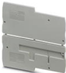
Flasque d'extrémité, Longueur: 74,4 mm, Largeur: 2,2 mm, Coloris: gris

Remarque : les données indiquées ici sont tirées du catalogue en ligne. Vous trouverez toutes les informations et données dans la documentation utilisateur. Les conditions générales d'utilisation pour les téléchargements sur Internet sont applicables. ( http://phoenixcontact.fr/download )