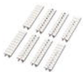
Repérage ZB, à commander : par bandes, blanc, impression selon les indications du client, Type de montage: Encliquetage dans la rainure de repérage élevée, pour bloc de jonction au pas de : 3,5 mm, Surface utile: 3,5 x 10,5 mm

Repérage ZB - ZB 3,5,LGS:FORTL.ZAHLEN - 0801404