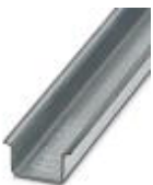
Profilé chapeau, matériau : galvanisé, non percé, hauteur 15 mm, largeur 35 mm, longueur : 2 m

Profilé plein - NS 35/15 ZN UNPERF 2000MM - 1206586