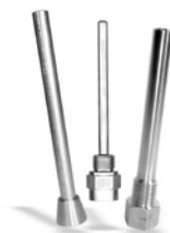
Doigts de gant

Exemple de référence pour une sonde de type MA avec une gaine de protection de 50 mm, Ø 6 mm en 1 x Pt 100 : MA6501