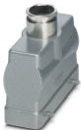
Capot passe-câble HEAVYCONNEC B24, pour verrouillage transversal, hauteur 76 mm, avec raccordement vissé 1x Pg21, sortie de câble droite

Remarque : les données indiquées ici sont tirées du catalogue en ligne. Vous trouverez toutes les informations et données dans la documentation utilisateur. Les conditions générales d'utilisation pour les téléchargements sur Internet sont applicables. ( http://phoenixcontact.fr/download )