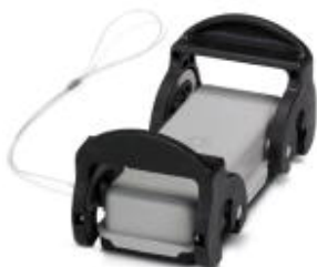
Couvercle de protection HEAVYCONNEC, série B16, pour capot sans verrouillage transversal, cordon de retenue, IP 54

Remarque : les données indiquées ici sont tirées du catalogue en ligne. Vous trouverez toutes les informations et données dans la documentation utilisateur. Les conditions générales d'utilisation pour les téléchargements sur Internet sont applicables. ( http://phoenixcontact.fr/download )