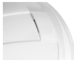
Zone de clipsage frontal pour lampe frontale

Utilisation : Destiné aux électriciens de réseaux , production, transport, distribution, exploitation et industrie. Conçu pour la protection contre l'arc électrique des courts-circuits.