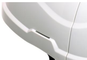
Zone de clipsage latéral pour lampe ou dispositif antibruit