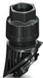
Presse-étoupe plastique EVO avec fermeture à baïonnette, taille M32, diamètre de câble 11-21 mm

Remarque : les données indiquées ici sont tirées du catalogue en ligne. Vous trouverez toutes les informations et données dans la documentation utilisateur. Les conditions générales d'utilisation pour les téléchargements sur Internet sont applicables. ( http://phoenixcontact.fr/download )