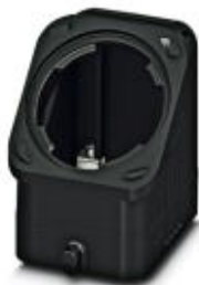
Capot passe-câble HEAVYCONNEC EVO en plastique, avec bride à baïonnette pour raccordement vissé EVO, B6, pour verrouillage longitudinal, hauteur 60,5 mm, sans raccordement vissé EVO

Remarque : les données indiquées ici sont tirées du catalogue en ligne. Vous trouverez toutes les informations et données dans la documentation utilisateur. Les conditions générales d'utilisation pour les téléchargements sur Internet sont applicables. ( http://phoenixcontact.fr/download )