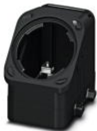
Capot passe-câble HEAVYCONNEC EVO en plastique, avec bride à baïonnette pour raccordement vissé EVO, B10, avec verrouillage transversal, hauteur 60,5 mm, sans raccordement vissé EVO

Remarque : les données indiquées ici sont tirées du catalogue en ligne. Vous trouverez toutes les informations et données dans la documentation utilisateur. Les conditions générales d'utilisation pour les téléchargements sur Internet sont applicables. ( http://phoenixcontact.fr/download )