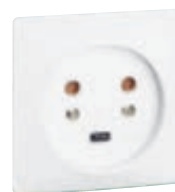
0 554 22