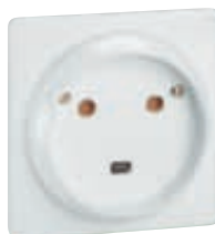
0 558 12