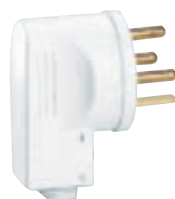
0 551 55