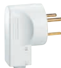
0 558 02