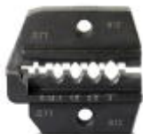
Matrice de rechange pour pince à sertir CRIMPFOX-1,6/2,5-ED-4,0

Matrice de rechange - CRIMPFOX-1,6/2,5-ED-4,0 DIE - 1886948