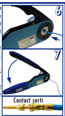
Tableau d'instruction :

Sertir ensuite en refermant à fond les deux branches de la pince jusqu'à sa réouverture. Vérifier visuellement que le contact est correctement sertie : le fil doit être visible par le trou d'évent et l'isolant du fil doit être appliqué contre l'arrière du contact.