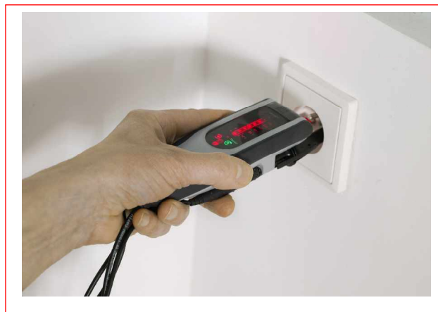
Position pour prise