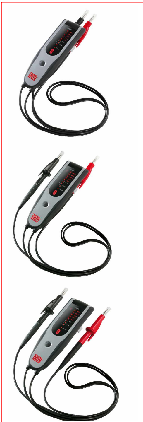
Position des pointes de touche selon 3 configurations.