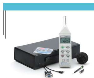
Le sonomètre-enregistreur C.A 834 et ses accessoires