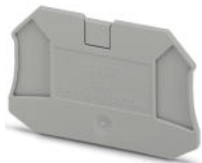
Flasque d'extrémité, Longueur: 65,4 mm, Largeur: 2,2 mm, Hauteur: 47,5 mm, Coloris: gris

Remarque : les données indiquées ici sont tirées du catalogue en ligne. Vous trouverez toutes les informations et données dans la documentation utilisateur. Les conditions générales d'utilisation pour les téléchargements sur Internet sont applicables. ( http://phoenixcontact.fr/download )